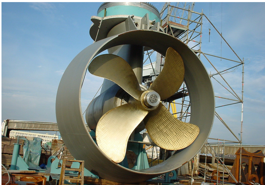
Skärning och plåtslageri är viktiga operationer på Deform.

Svetsade podar är bara ett exempel på vad vi kan göra. Vi ser hellre möjligheter än problem och vill gärna vara med tidigt i processen vid framtagningen av nya formade produkter!