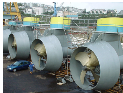
Färdiga podhus på kaj för lastning.