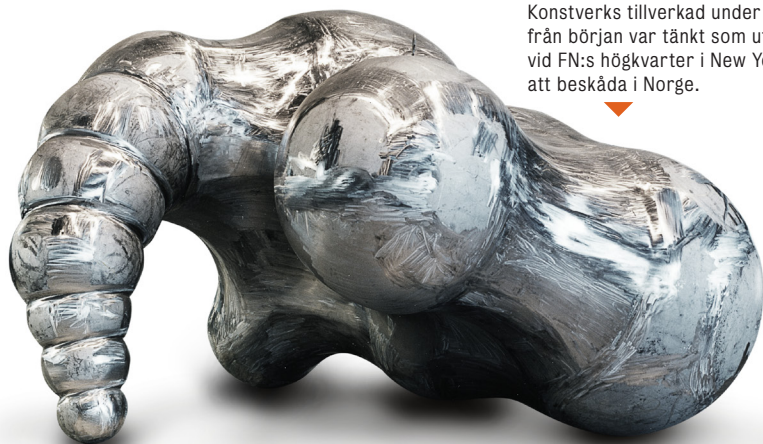
Konstverks tillverkad under 2002 som från början var tänkt som utsmyckning vid FN:s högkvarter i New York. Finns nu att beskåda i Norge. ▼