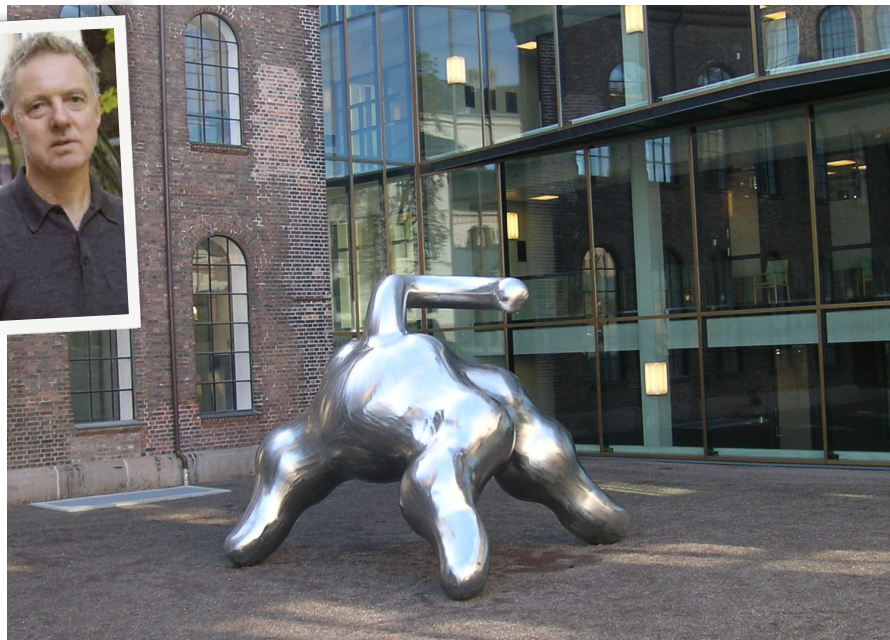
▲ Skulptur placerad vid Akershus Festning, Norge.