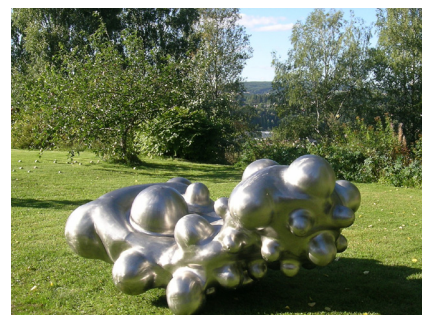
En del i konstverkserien Alexis, tillverkad 1998 för utsmyckning av Norges nya flygplats i Gardemoen. ▼