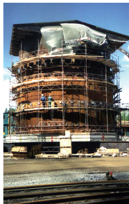
▲ En av flera masugnar levererade av Deform.