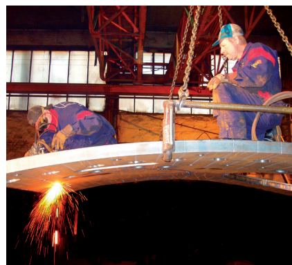
▲ Mantelsegment med tjocklek 60 mm.